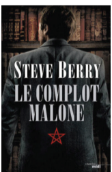
Le complot Malone Steve Berry