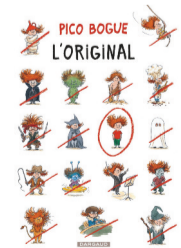
L'original Pico Bogue