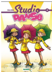
Studio Danse Crip & Béka